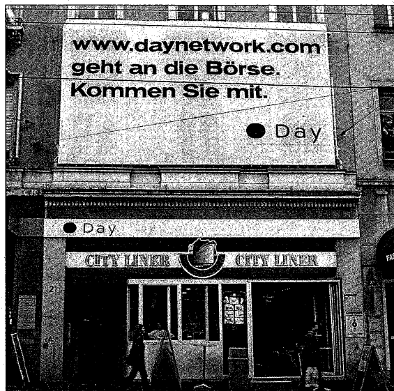
Die Zeit grosser Werbesprüche ist vorbei. Nüchterne Fakten und Zahlen prägen die IPO-Kommunikation von heute.

Die grössere Bedeutung der Institutionellen beeinflusst die Prioritäten und die